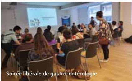
Soirée libérale de gastro-entérologie

Plusieurs fois par an, dans nos locaux ou en visio, l'URPS médecins organise des soirées de rencontres par spécialité entre internes, chefs de clinique, remplaçants et médecins installés, grâce à son partenariat avec le Syndicat des internes des hôpitaux de Paris (SIHP).